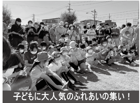
自治会行事は子ども中心です！

進み、高齢者だけの世帯、単身世帯が増加しています。その中で「自治会費が納められない」「組長ができない」という声が多くなってきました。