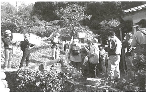
平佐焼窯跡の歴史さんぽで説明する「歴史遺産お守り隊」

同時期に河川改修による道路の整備事業に伴い、八つの窯跡の一つ、「柚木崎窯」（ゆのきざきがま）の発掘調査が行われることになったため、同年11月に「第2回平佐西地区歴史さんぽ」で、発掘箇所を「平佐西歴史さんぽ」のコースに組み込み実施しました。その際、さんぽコースの歴史ガイドを「歴史遺産お守り隊」