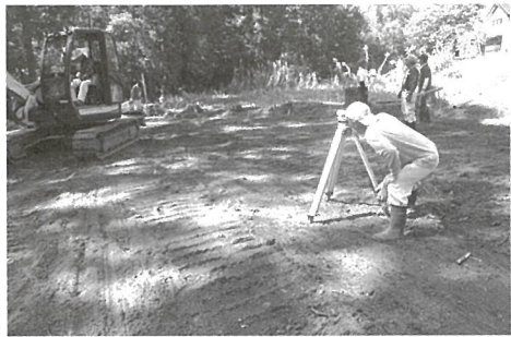
周辺環境整備のため、コミュニティ協議会員が駐車場整備

隊員が担当し、発掘現場の見学は、鹿児島県文化振興財団埋蔵文化財調査センターの協力により、多くの市民が見学することができました。