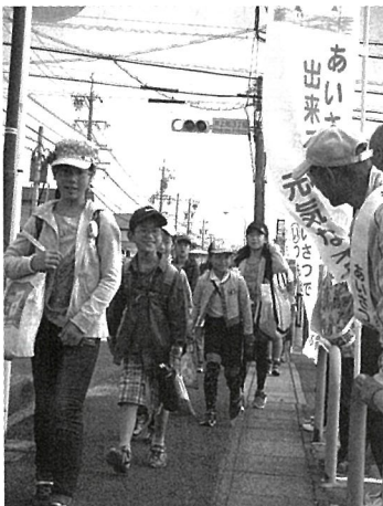
「挨拶立哨」幟を立てて立哨。子どもたちの元気な声