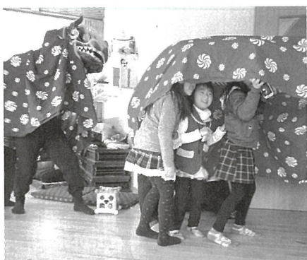
「獅子舞」会の発足以来続いており、地域の恒例行事となっている