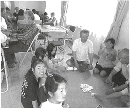
「さろん風景」学校が休みの土曜日などは大人も子どもももごちゃまぜ