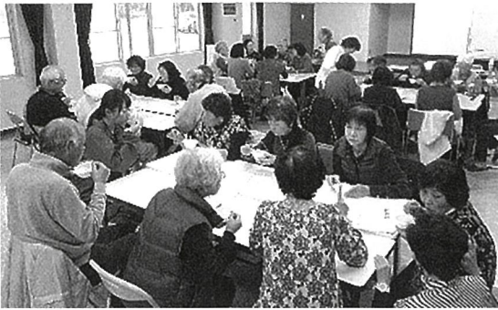
「健康セミナー・骨折防止で健康寿命UP」試食タイム、カフェブレイクなど笑顔になる企画