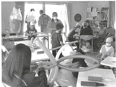
「キッズサタデー」楽しくバルーンづくり

いつまでも元気で、そしていつまでも我が家に住み続けたいという高齢者の思いに寄り添うため、健康寿命UPのための講座を