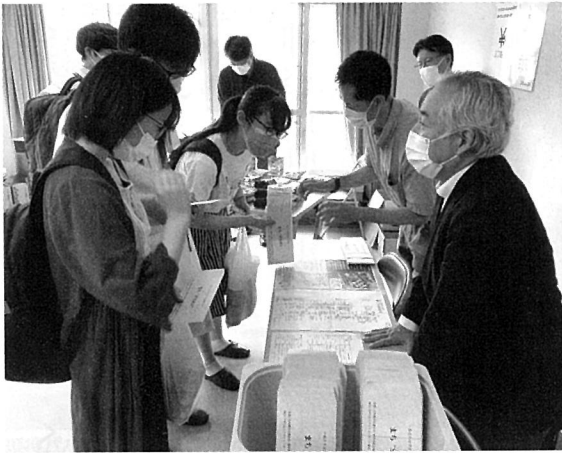
六角橋地区の魅力を伝えながら想いの詰まった「まち“SHOKU” 応援券」を手渡す商店街会長