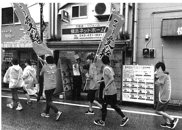
世界アルツハイマーデーに実施、学生らしく認知症啓発活動「オレンジプロジェクトの一部」

アに参加するなど、是非自分も力になりたいと思います」「人と関わる機会が減っているの で、少しでも誰かと話せる機会があるだけで嬉 しいです」との感謝の気持ちがまちの皆さまへ 返され、このような御時世においても、まちと 学生のつながりは着実に実を結んでいる。