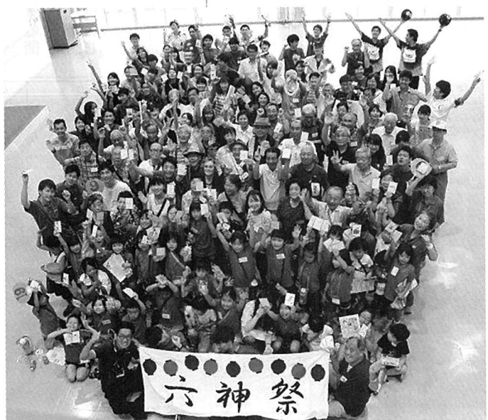
子どもから自治会役員まで大学生がつなく世代間交流イベント「六神祭」

その声を聞いた地元自治会は「普段から付 き合いのある学生が困っている。明日の食べる ものに心配するような学生が身近にいる。今す ぐ動かないといけない」と立ち上がり、5年間 にわたりつないできた地域のネットワークを活 用し、全3回(約480名)の食支援を実施した。