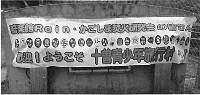
伊佐市に横断幕を用意していただき、デイキャンプイベントを開催。

2020年7月末現在で、本会の会員は世帯主数だけで1115名。第2次アウトドアブームの追い風で地元メディアにも取り上げられるなどしたため、現在も鹿児島県内外に会員が広まりつつある。現時点では法人化を予定しておらず、有志による会の運営がなされている。