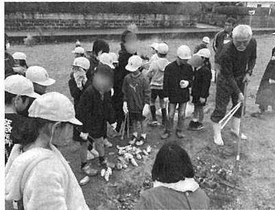
体験だけでなく自分の行動の予測や振り返りを 火に対する正しい向き合い方を体験する 行う

よく表れる活動なので積極的に取り入れるようにしている。この他に、調理したものを盛り付ける皿や茶碗、箸を竹で作らせたり、調理で使う食材を取りに行かせたりする活動を地域の協力で取り入れるようにし、体験活動に紐付けた達成感を提供するように心がけている。