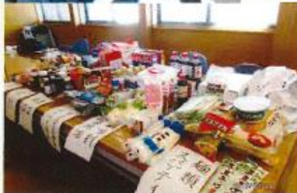
集めた食品を直接お届けしています