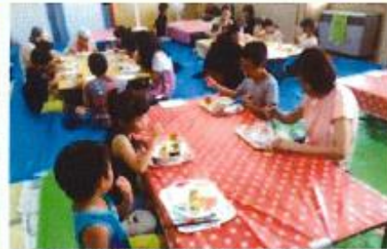
子ども食堂に取り組む生活学校もあります

1) 生活学校とは、女性を中心に、身近な暮らしの中の問題を、学び、調べ、企業や行政と話し合い、ほかのグループとも協力し合いながら、実践活動の中で解決し、生活や地域や社会の在り方を変えていく活動、生活会議とは、地域で起こる様々な問題を、住民同士、地域作りグループ同士、行政や企業との話し合い、地域のまとめ役として実践活動を通じて解決することにより、快適で安全な住み良い地域社会を創っていく活動です。